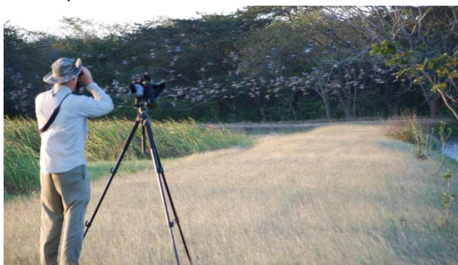
Fig. 3. J. Zook un experimentado observador de aves de Costa Rica en busca de una especie nueva para su lista de vida; Oxyura jamaicensis en Guanacaste.

Es por esto que la observación de aves se está convirtiendo en "el segmento de más rápido crecimiento y más conciencia ambiental del ecoturismo y la mejor esperanza económica para muchas áreas naturales asediadas por el crecimiento humano" (Sekercioglu, 2003).