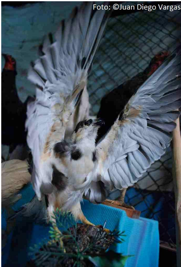
Fig. 1. Gamponyx swainsonii disecado a la venta como adorno en el mercado de Masaya, Nicaragua, Mayo, 2011.

observación de aves, senderismo, “backpacking”, deslizamientos sobre nieve y caminatas. Otros eventos aislados también nos dan pistas evidentes de la popularidad de la